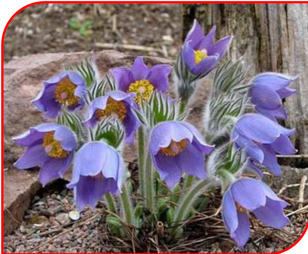
Прострел раскрытый, или Сон-трава